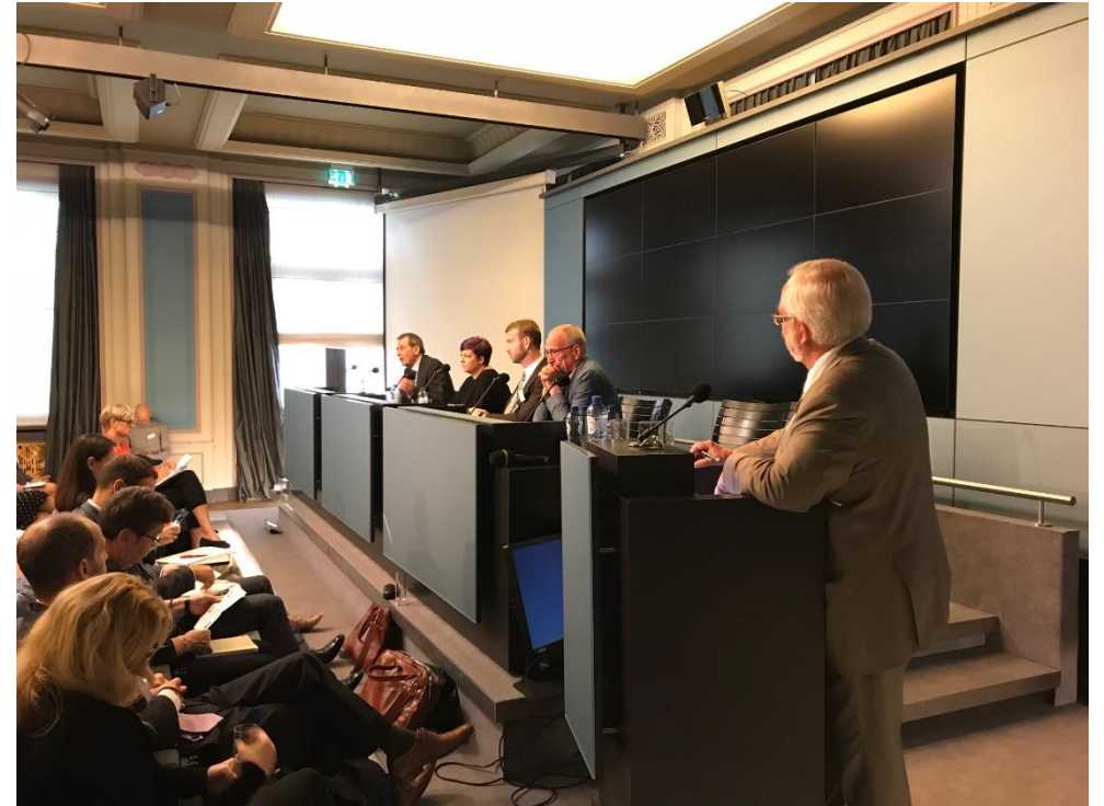
Svereg-konferensen juni 2018