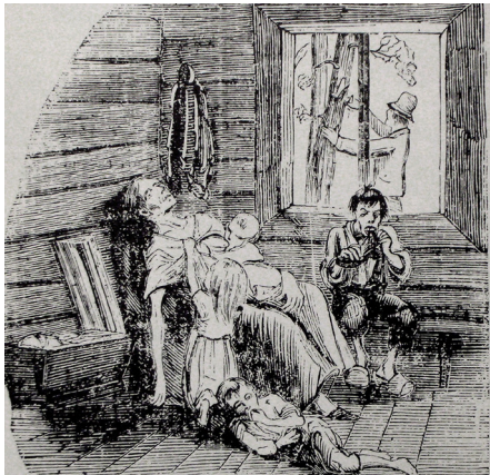
Svälten i Norrland. Tidningen Fäderneslandet, 1867. En moder ligger döende medan sonen äter på en känga och en man täljer bark från trädet utanför.

Under slutet av 1860-talet blev det dåliga skördar i Sverige. Befolkningen svalt och för att kunna överleva åt man bröd bakat med bark och gröt gjord på lavar. Eftersom undernäring var ett vanligt problem blev döden ett naturligt inslag i många familjer. Ur detta föddes hoppet om ett bättre liv någon annanstans.