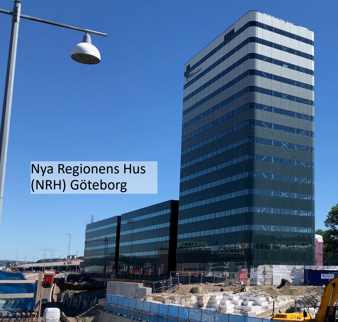
Nya Regionens Hus (NRH) Göteborg

NRH Skövde 400 medarbetare Inflyttning december 2018