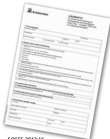
SOSFS 2012:16 Läkarintyg krävs