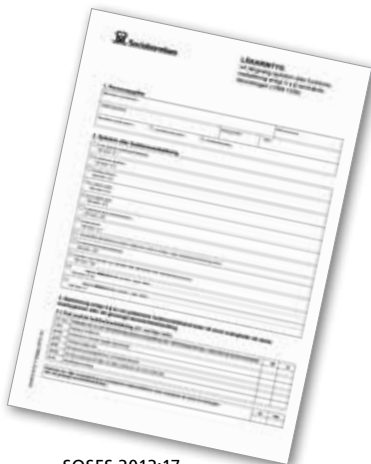
SOSFS 2012:17 Läkarintyg krävs

Läkarintyg med diagnos och funktionsbedömning ska bifogas vid ansökan. Enhet Tandvård beslutar om personen har rätt till intyg om F-tandvård.