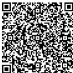
O sigmoideoskopiji na 1177.

Ako želite saznati više o sigmoideoskopiji, možete pročitati o tome u Zdravstvenom savjetovalištu 1177.