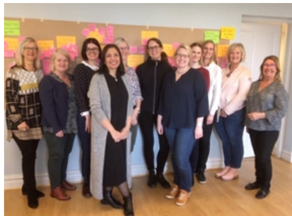
Regionalt processteam endometrios

Läs mer på vårdgivarwebben om processteamets uppstarts dagar