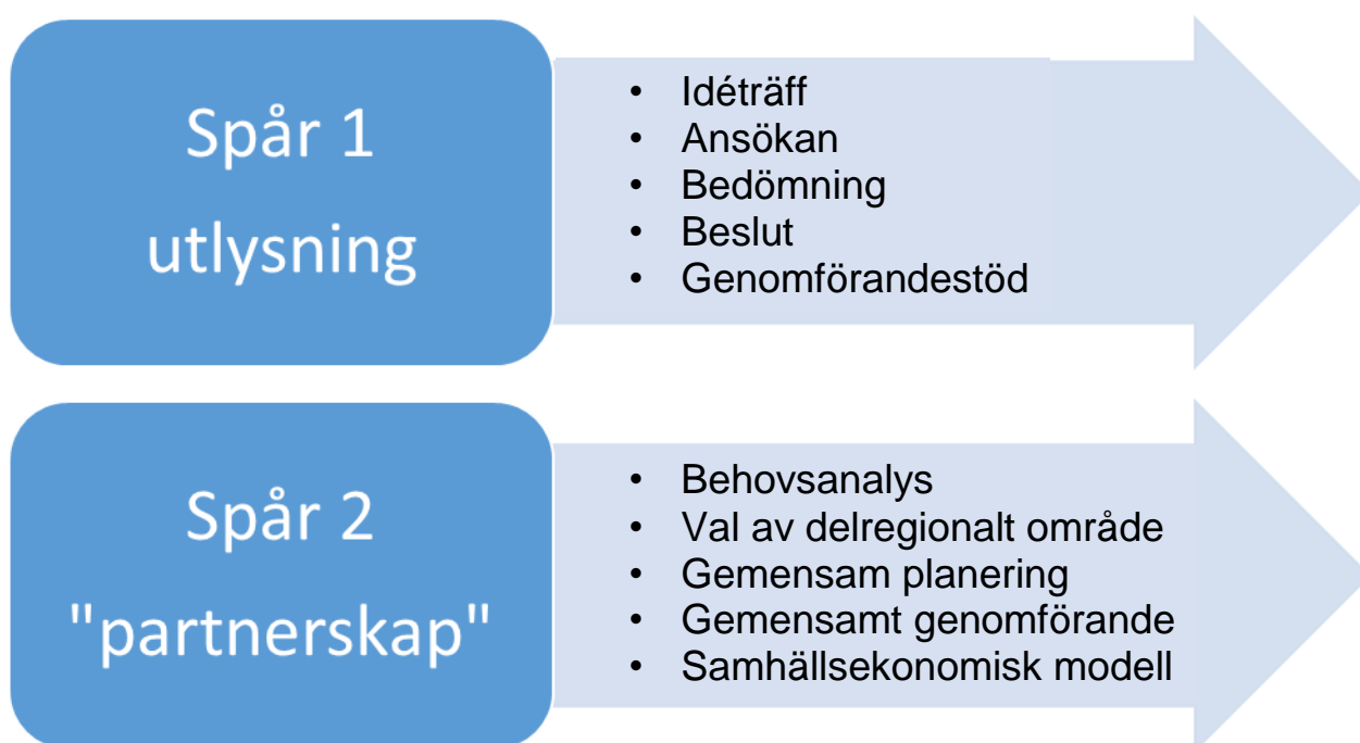
Figur 1. VGRs modell för sociala investeringar – skillnader mellan spår 1 och 2.

Västra Götalandsregionens modell för sociala investeringar har två spår där spår 1 baseras på utlysning av projektmedel. Spår 2 är strategiskt och utgår från ett prioriterat geografiskt område. Prioriteringen baseras på gymnasiebehörighet bland avgångselever i grundskolan. Spår 2 syftar till att skapa en infrastruktur för samverkan mellan region och kommun på längre sikt. De två spåren bildar tillsammans en helhet och är beroende av varandra då vissa huvudsakligen lämpar sig för projekt medan andra kräver en större grad av långsiktighet och samverkan mellan jämbördiga parter.