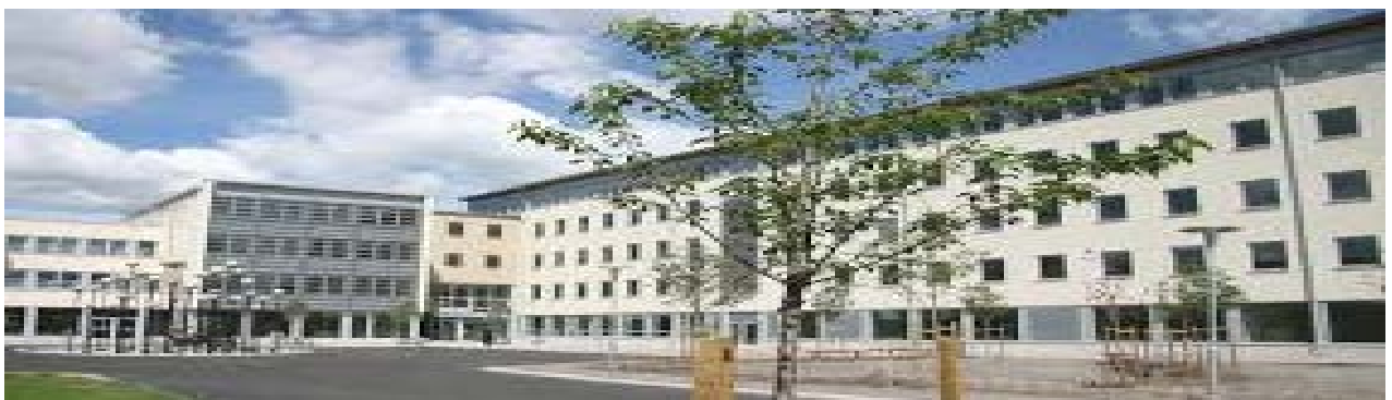
Högskolan Väst, Trollhättan