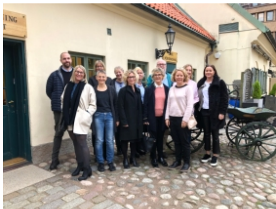
Regionalt processteam diabetes

- Det vi har prioriterat att arbeta med är utbildning/fortbildning, ögon och fötter. Vi har generellt sett långa väntetider för ögonbottenfoto men vissa sjukhus ligger helt rätt i kallelser och uppföljning. I vår region har vi en något högre andel amputerade än andra regioner. Är det på grund av dålig vård som bottnar i strukturella fel eller finns det andra orsaker? Det finns tydliga riktlinjer för hur diabetesvård ska bedrivas och den totala bilden ser bra ut, men gapen är stora inom regionen.