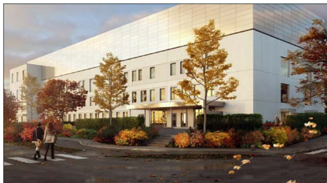
Den planerade nybyggnaden, sedd från sjukhusets stora parkeringsplats.

Den systemhandling – dvs. den samling ritningar och dokument som beskriver verksamheten, byggnaden, tekniska system och kostnadsberäkningar – kommer att färdigställas under december, för att sedan lämnas till politikerna i sjukhusets styrelse, fastighetsnämnden samt regionen för beslut. Om poli-