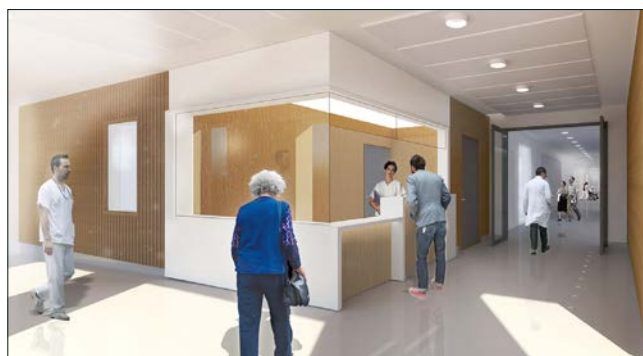
Receptionsdisk i de nya röntgenlokalerna.