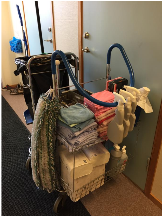
Rätt utrustad stadvagn