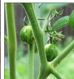
Växthusets tomater kommer att hanna på salladsbordet i restaurangen. Insektsbon borgar för bra pollinering.