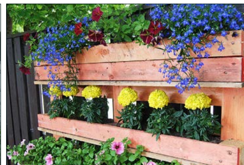
Gamla lastpallar har omvandlats till blomlådor som pryder planket runt uteplatsen.