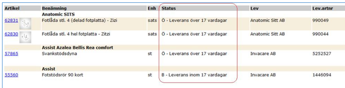
Figur 2. Exempel på hur det kan se ut i dagsläget.