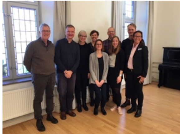
Regionalt processteam lunginflammation

- Vi har kommit fram till att en standardiserad allvarlighetsbedömning är basen för att handlägga patienter med misstänkt pneumoni på ett adekvat sätt. Allvarlighetsbedömningen styr sedan val av mikrobiologisk statistik, antibiotikaval och fortsatt uppföljning av vitalparametrar.