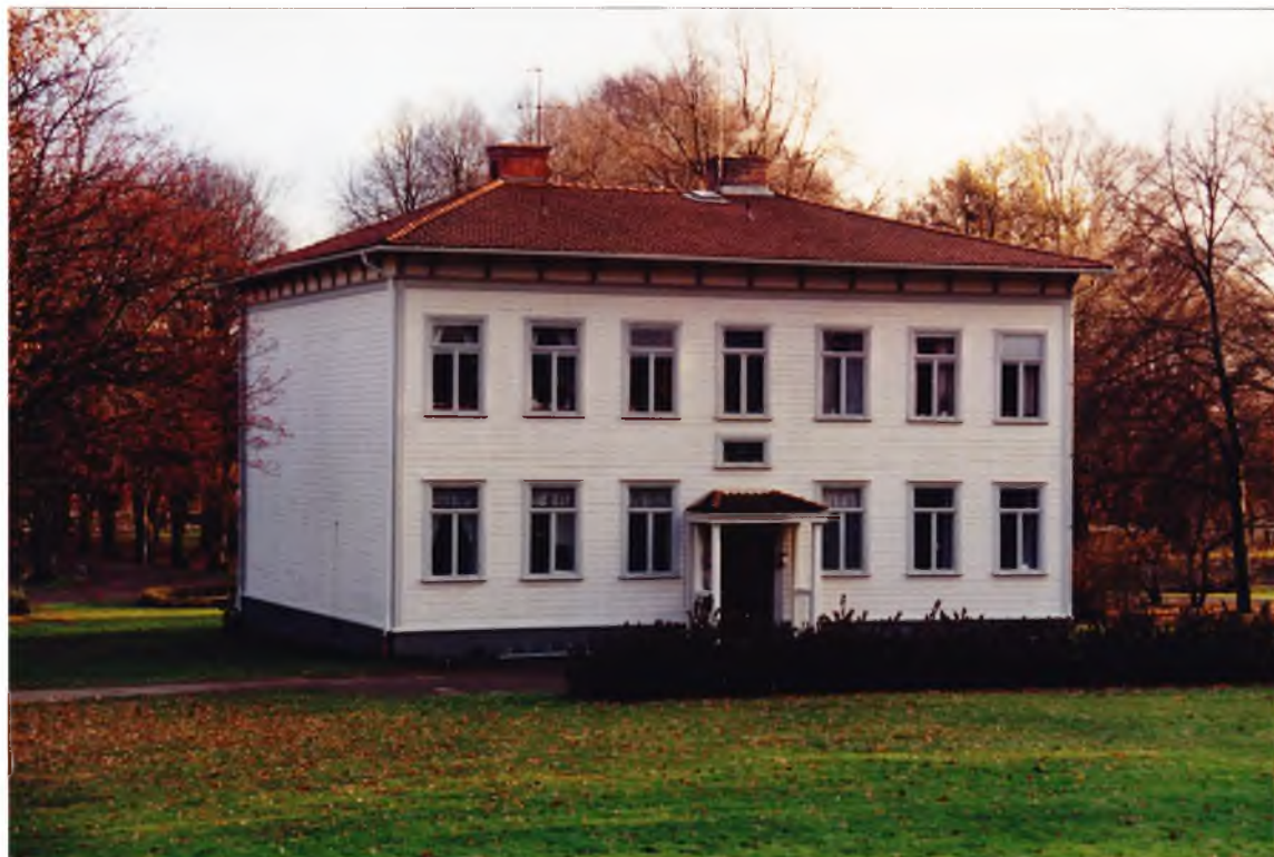
Byggnaden från väster. Märk avsaknaden av fönster på gaveln. Nov. 1995. 95/621:27