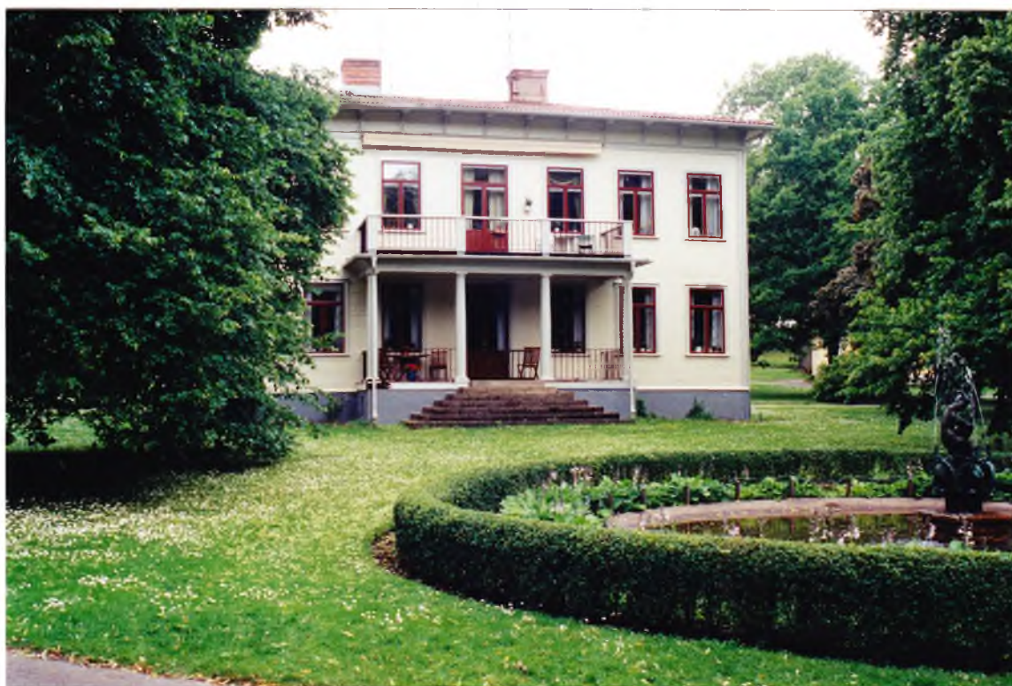
Societetsvillan från öster efter ommålning. Notera det enfärgade markistyget. Juli 2002.