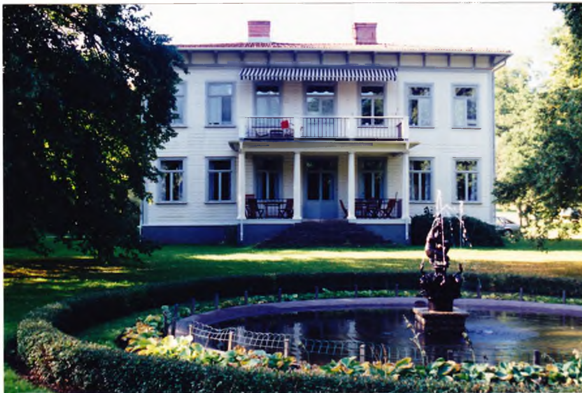
Societetsvillan från öster före ommålningen. Huset var här målat gråvitt med grå fönstersnickerier. Notera markisens randiga tyg. Sept. 1995. 95/363:25