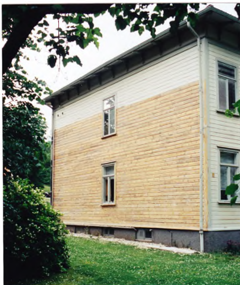
100-procentig färgborttagning med "Speedheater" på södra gaveln. Juli 2001. 01/150:2A