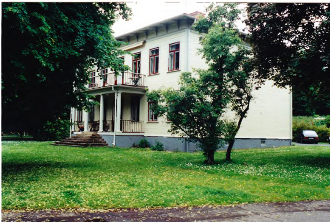
Societetsvillan från nordost efter ommålning. Juli 2002.