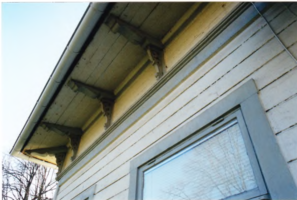
Societetsvillan, detalj av takfoten med profilerade sparrändar och figursågade konsoler – de enda detaljer som kan förmodas vara bevarade från 1870-talet. Maj 2001. 01/75:34