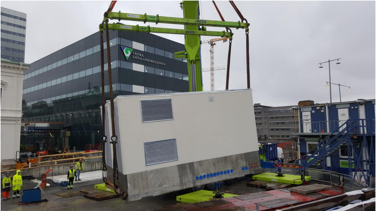
Lyft av transformatorstation (vikt ca 30 ton)