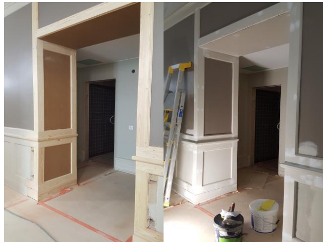
Före och efter