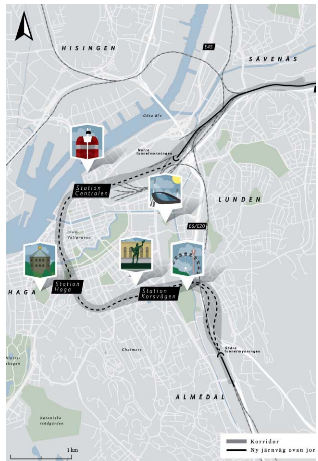
FIGUR. Västlänkens sträckning.

Pendeltågslinjerna och flertalet regiontågslinjer ska vara genomgående i Göteborg och på lämpligt sätt kopplas ihop norr och söder om Västlänken. Fjärrtågen, samt en del av regiontågen (se nedan), föreslås gå som i dag till säckstationen i markplan vid Göteborg central. Godståg, fjärrtåg och regionexpresståg förutsätts trafikera Gårdatunneln.