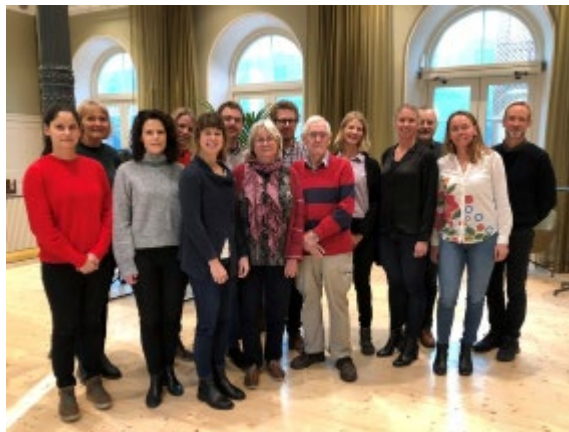
Regionalt processteam sekundärprevention vid kranskärslssjukdom

Ett konkret resultat av teamets arbete är en digital hjärtskola som startade på Sahlgrenska Universitetssjukhuset i april och som ska implementeras på flertalet sjukhus i regionen under hösten.