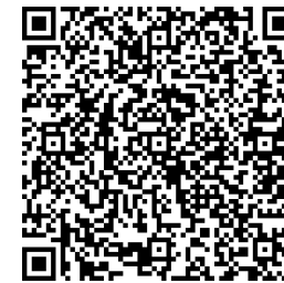
Om koloskopi på 1177.

Om du vill veta mer om koloskopi kan du läsa om det på Vårdguiden 1177.