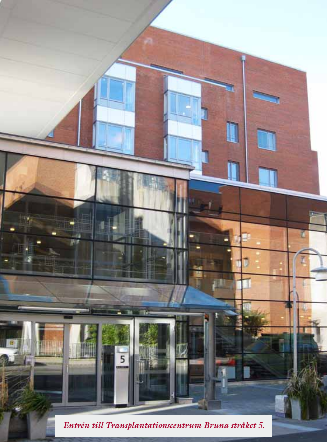
Entrén till Transplantationscentrum Bruna stråket 5.