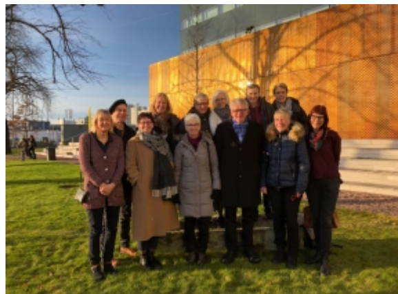
Regionalt processteam medicinsk retina

- Att det finns mycket att göra och mycket att vinna på strukturerat gemensamt arbete. Samtidigt har vi insett att det finns vissa svårigheter med att införa gemensamma riktlinjer i regionen då de olika klinikerna har olika förutsättningar.