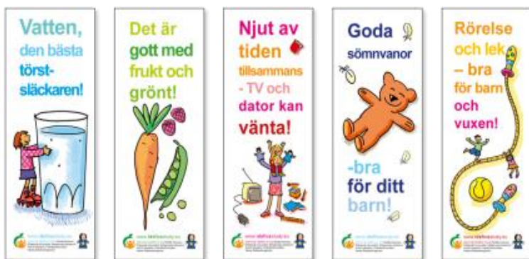
Bild 3. Informationsfoldrar från Idefics projektet.