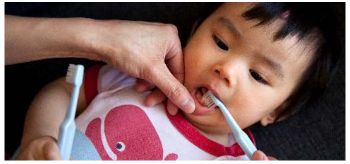
به فرزند خود کمک کنید صبح و شب دندانهای خود را با خمیر دندان دارای ماده فلئور مسواک بزنند.