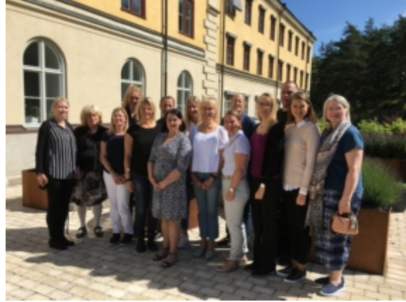
Regionalt processteam smärta

- Vi upplevde att vi under uppstartsdagarna uppnådde samsyn inom processteamet kring patientprocessen för långvarig smärta i VGR och även kring de viktigaste målen för medicinsk och patientupplevd kvalitet. Det finns mycket förbättringspotential när det gäller smärtvården i VGR och teamet planerar att arbeta parallellt med kortsiktiga och långsiktiga förbättringar.