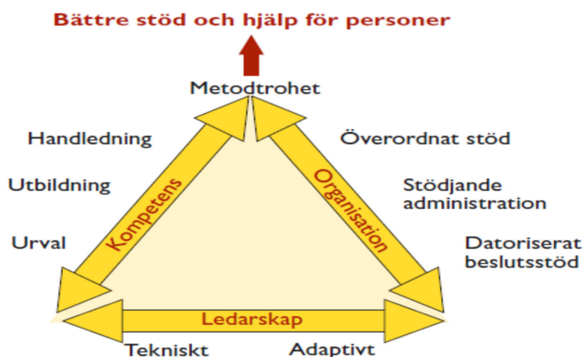
Figur 2. Implementeringsmodell

Faktorer som visat sig ha stor betydelse för att lyckas med en implementering av ett nytt arbetssätt eller en ny metod visas i figur 2.