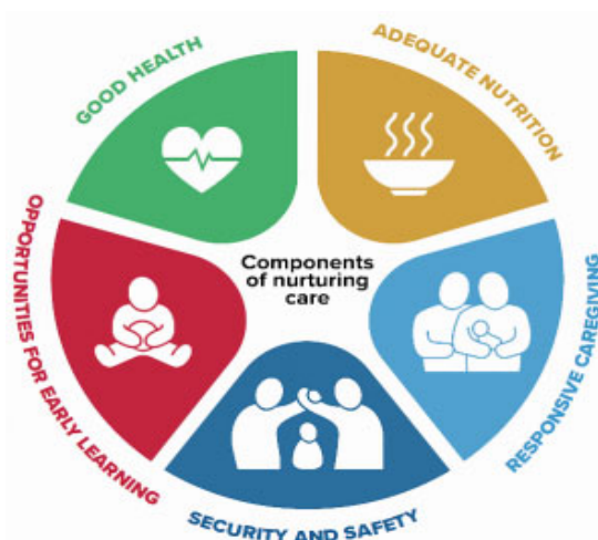
Figur 1. Nurturing Care-komponenter

Utökade hembesök är en Nurturing Care -insats kopplad till de globala målen för hållbar utveckling, för att främja barns utveckling under deras första 1 000 dagar i livet (WHO et al, 2018).